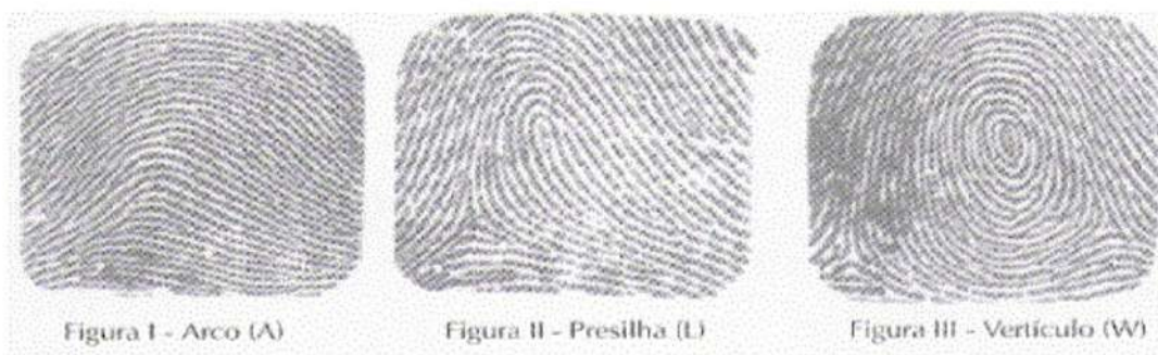
Figura 1. Tipos de desenhos dermatoglíficos.

Os desenhos dermatoglíficos podem ser de três tipos: arco (A), presilha (L) e verticilo (W). As IDs recebem uma numeração que está relacionada ao número de deltas que o desenho possui. O arco é 0, pois não possui delta. A presilha possui 1 delta e o verticilo possui 2 deltas. Somente os desenhos que possuem deltas têm suas linhas contadas, linhas essas que farão parte do SCTL (Somatório da Quantidade Total de Linhas).