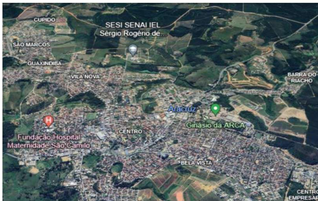
Imagem de satélite: Local de realização do projeto, com fácil acesso às comunidades mais carentes do município de Aracruz