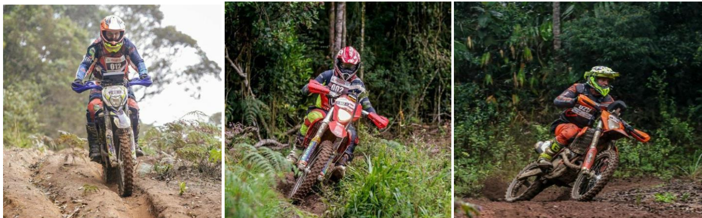
Trilhas – Região das Montanhas Capixabas - 2021