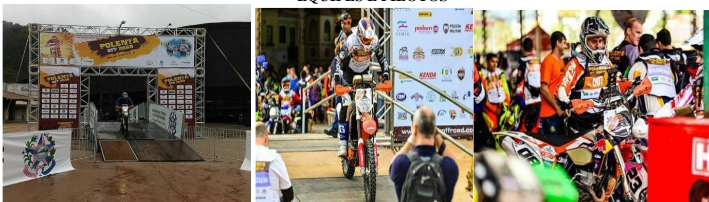
Estrutura de largada e chegada - 2019

Centro de Eventos Pe. Cleto Caliman - Venda Nova do Imigrante / ES